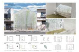
塚越智之《狭小の森》