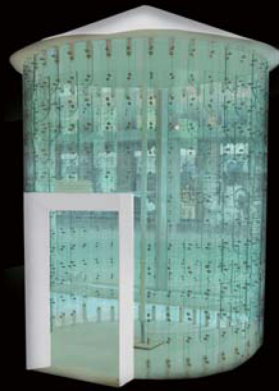
2012 年度最優秀賞：米澤隆「Glass Pavillion」