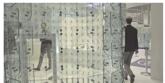
2012年度最優秀案の実現した様子