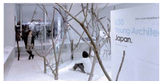
2011年度最優秀案の実現した様子