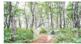
小引寛也 + 石川典貴