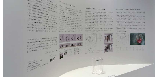
2016年度 最優秀設計者の提案