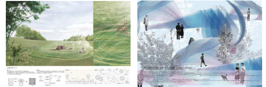
優秀賞 岩田知洋+山上弘 優秀賞 植村通